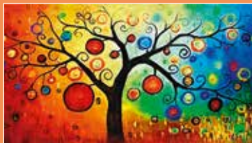
Abstract Painting Wallpaper.